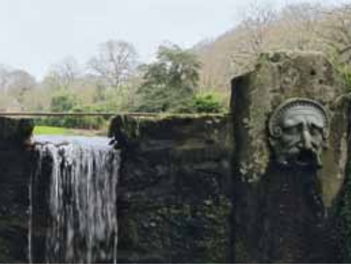
La cascade du grand étang.