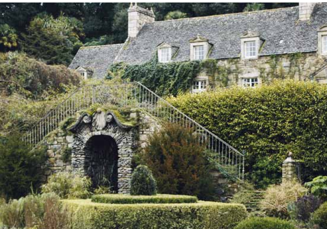
Le manoir vu de la terrasse des «4 carrés».

Un jardin classé «Jardin remarquable» dans les Côtes-d'Armor et qui réunit plus de 9000 plantes différentes agencées dans la tradition des jardins anglais avec des éléments des jardins italiens. Une collection extraordinaire de camellias et de rhododendrons et de bien d'autres arbres.