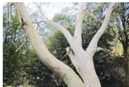
Eucalyptus et camellia.

La fontaine est entourée d'un bosquet de Chusquea couleou , un bambou avec de belles cannes; son eau alimente l'imposant étang bordé d'une forêt de Gunnera manicata dont on a coupé les feuilles pour les poser sur les pousses. Un arbre à petites feuilles ovales, étroites, persistantes et brillantes, d'un vert foncé et au bord dentelé accroche le regard: Nothofagus dombeyi . Les arbres de Kerdalo ressemblent à ceux que l'on rencontre dans les livres de Tolkien. Isabelle Vaughan les évoque avec affection; la plupart n'excèdent pas un mètre de hauteur à leur plantation.