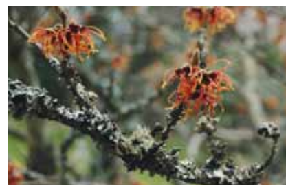
Hamamelis x intermedia 'Diane'.