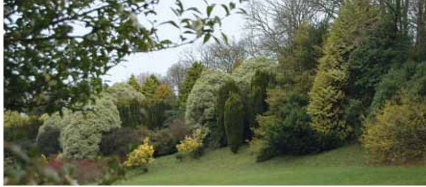
La lande dorée.

L'eau s'échappe de l'étang pour poursuivre sa course: jeu du voile de la mariée, cascade douce et, au final, fracas au cœur du coquillage qui a vu naître Vénus. L'eau est magnifiée; elle termine sa course dans l'estuaire de Tréguier. Le vallon humide abrite une rangée de fougères arborescentes ( Dicksonia ) qui partagent les lieux avec les Woodwardia et leurs magnifiques feuilles persistantes. Hortensias, rhododendrons, Acer peuplent les pentes humides. Les camélias, dont certains sassanqua, commencent à fleurir. J'ai admiré le Myrtus luma , un arbre provenant du Chili. Son écorce ressemble à un velours précieux de couleur caramel, elle est mise en valeur par les petites feuilles persistantes de l'arbre.