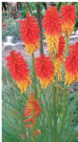
Fot. 8. Tryptoma 'Papaya

← brązowymi, potem ciemnozielonymi z brązowoczerwonym obrzeżeniem liśćmi (fot. 7). Pojawiające się w czerwcu i lipcu kwiaty są różowoczer-