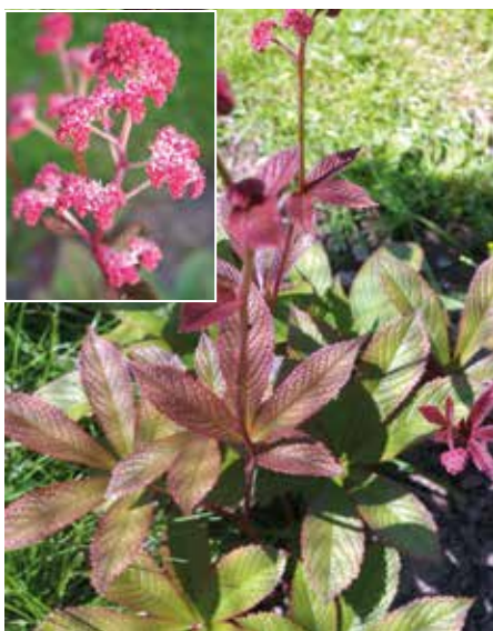
Fot. 7. Rodgersja Henriciego 'Cherry Blush'®