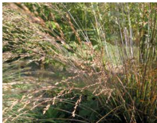
Fot. 9. Trzészlica 'Les Ponts de Cé'