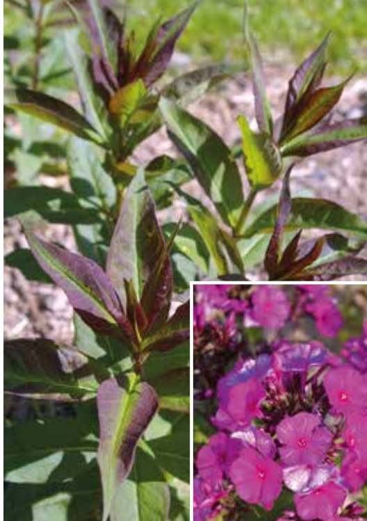
Fot. 2. Floks wielkolistny 'Shemeneto' – młode liście i kwiaty

◆ Jeżówka ( Echinacea ) ' Meditation White ' ® – wyróżnia się bardzo zwartym i gęstym pokrojem. Rośliny osiągają wysokość do ok. 50 cm. Bardzo liczne kwiatostany składają się z białych kwiatów jęczyczkowatych i pomarańczowożółtych →