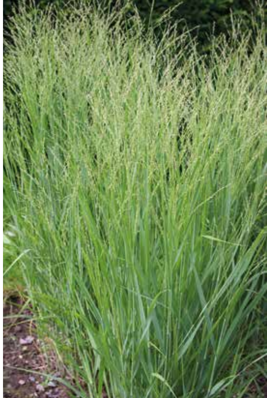
Fot. 5. Proso różgowate 'Buffalo Green' PBR

pie, w eksponowanym miejscu. Kwiatostany pojawiają się od sierpnia do października. Odmianę tę otrzymał Jan Spruyt z Belgii.