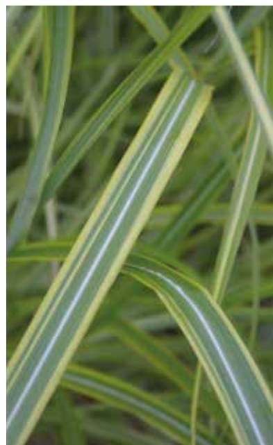
Fot. 4. Miskant chiński odm. zwarta 'Luc André Lepage'

liśćmi, które są podłużnie paskowane, zielono-limonkowe, a przez środek blaszki przebiega przez nie dodatkowo biały pas (fot. 4). Jesienią zielone odcienie zmieniają się na purpurowe i żółte. Dodatkową ozdobą są brązowopurpurowe wiechy kwiatostanowe, które pojawiają się od września. Rośliny osiągają wysokość ok. 150 cm. Od-