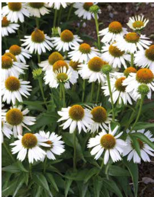
Fot. 3. Jeżówka 'Meditation White'®

← kwiatów rurkowatych osadzonych na wypukłym dnie kwiatowym (fot. 3). Hodowcą odmiany jest Marco van Noort, a do konkursu zgłosiła ją firma Rijnbeek and Son perennials export B.V.