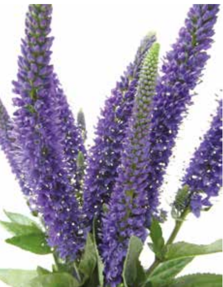
Fot. 6. Przetacznik długolistny 'Marietta'®