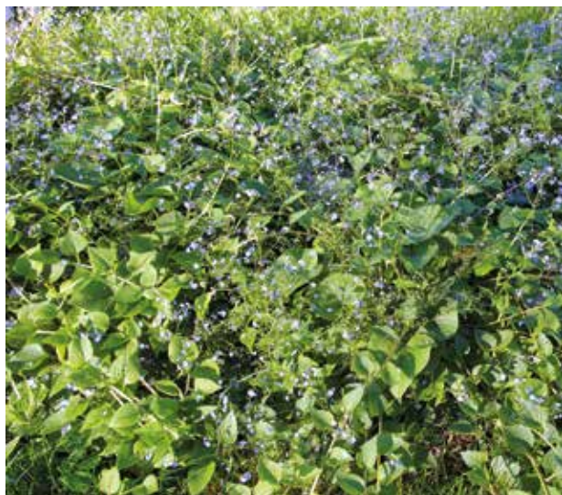
Fot. 1. Brunera wielkolistna ‘Caucasian Carpet’

◆ Brunera wielkolistna ( Brunnera macrophylla ) ‘Caucasian Carpet’ ma duże, sercowate, jasnozielone liście, które bardzo dobrze pokrywają